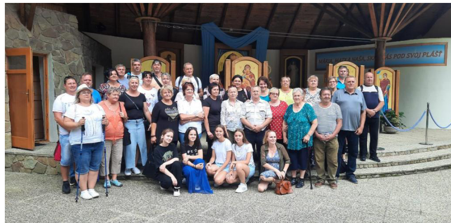
Púť na Horu Zvir, Litmanová.

Práve realizované aktivity farskej charity v členoch vzbudzujú radosť z pomoci bližným.