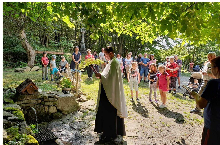
Posvätenie prameňa studničky v Oáze pokoja.

Naša farská charita sa zameriava na niekoľko oblastí. Jednou z nich je pomoc rodinám v sociálnej núdzi, kde sa poskytuje základná materiálna pomoc, ako napríklad potraviny. Organizujeme pravidelné prvopiatkové zbierky trvanlivých potravín. Prioritne sa z nich pomáha ľuďom v núdzi vo farnosti, a zvyšok sa doručí na charitu do Prešova.