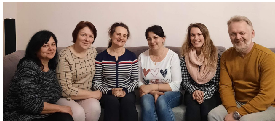
Stretnutie s koordinátorkou FCH.

Členovia farskej charity vyjadrili nadšenie pre pomoc blízkym, a to konkrétne tak, že môžu byť „predĺženou rukou“ prešovskej gréckokatolíckej charity a prispieť tak konkrétnou pomocou tým, ktorí to najviac potrebujú.