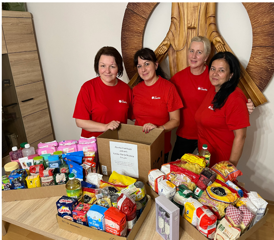
Členky FCH Brusnica pri zbierke potravín.

V júni 2024 sa uskutočnila v poradí druhá zbierka trvanlivých potravín organizovaná Farskou charitou Brusnica v spolupráci s gréckokatolíckym farským úradom Brusnica. Išlo najmä o základné potraviny, akými sú cestoviny, ryža, múka, konzervy a iné trvanlivé potraviny. Spoločným úsilím sa im podarilo vyzbierať až 50 kg trvanlivých potravín.